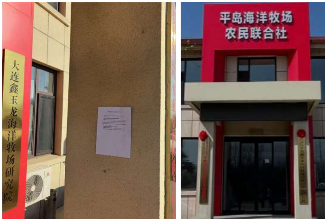
图 5 张贴公示照片

我单位于 2026 年 1 月 6 日在项目附近居民住地及人流较多的“平岛海洋牧场农民联合社”办公楼处进行了张贴公示，地址位于辽宁省大连市普兰店区皮口街道平岛社区，公开期限为 2026 年 1 月 6 日~2026 年 1 月 19 日，10 个工作日。