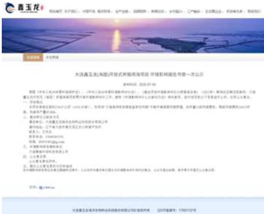
图 1 第一次网站公示截图