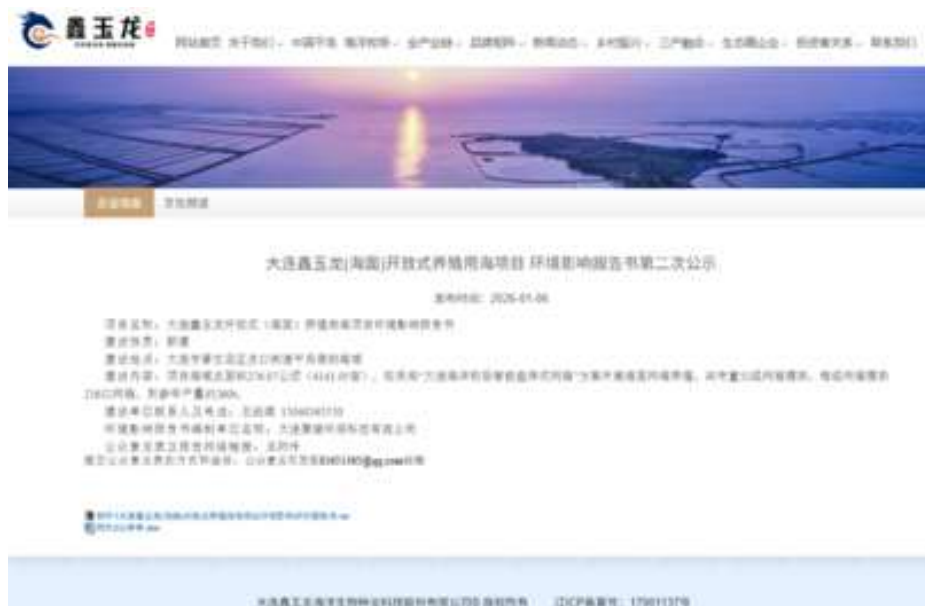
图2 第二次网站公示截图