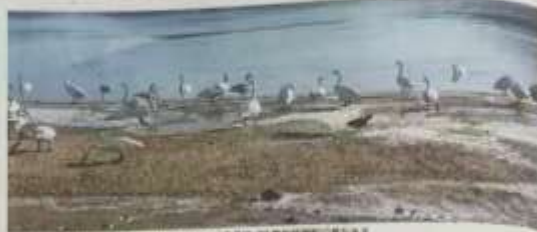
我国境内分布的三种天鹅都曾造访大连

小天鹅和疣鼻天鹅的越冬记录则相对较少。小天鹅通常在大连湾的浅滩越冬,而疣鼻天鹅则更喜欢在湿地的芦苇丛中越冬。黑天鹅的越冬记录则更为罕见,仅在少数年份有记录。