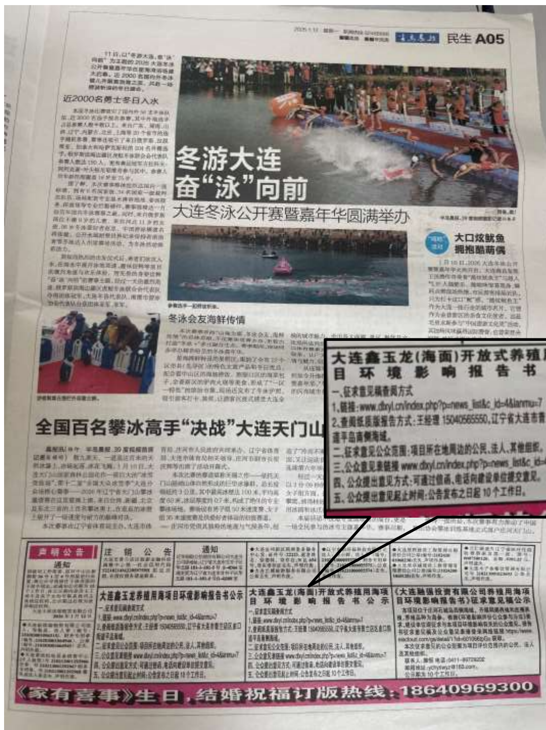
图4 第二次报纸公示截图